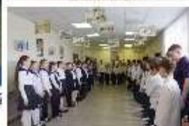
15 мая Выставка «ГЕРОИ МОЕЙ СЕМЬИ»