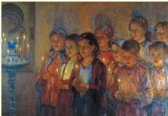
Н. П. Богданов-Бельский. В церкви. 1939 г.

Текст учебника дополняет богатый иллюстративный материал: картины русских и зарубежных художников, иконы, фотографии.