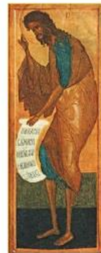
Иоанн Креститель. Икона. XV в.

Однажды Иоанн увидел приближающегося к нему Иисуса. Так как Иоанн был пророком, он узнал в Нём Спасителя, которого так долго ждал народ Израиля, и обрадовался. К удивлению Иоанна, Иисус попросил крестить Себя. Почему Иоанн удивился? Потому что Христос не нуждался в очищении, ведь Он был Сыном Божиим, а значит, безгрешным. Но Иисус всё равно пожелал принять крещение, чтобы подать пример другим людям. Тогда Иоанн возложил руку на голову Иисуса и крестил Его.