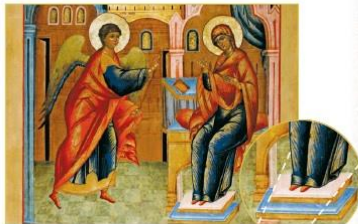
Благовещение. Икона. Фрагмент. XIX в.

Для упрощения усвоения материала представлены сравнения и схемы.