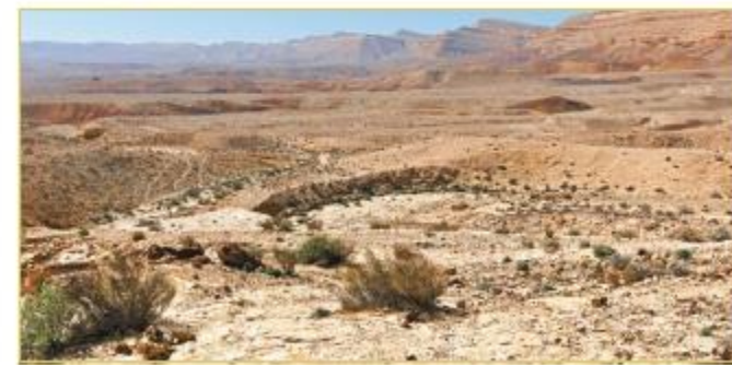
Иудейская пустыня. Современная фотография