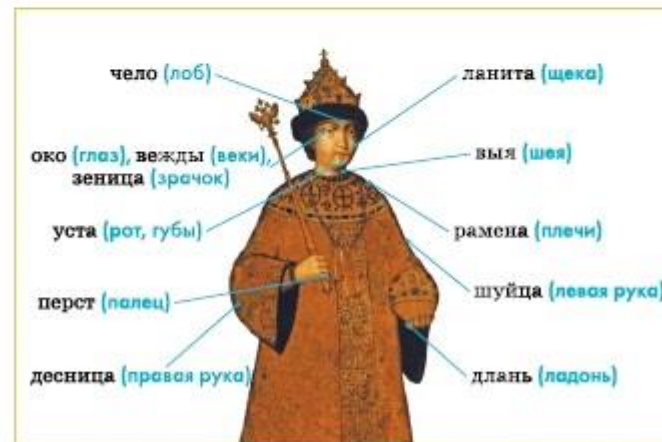
Примеры церковнославянских слов

Но если мы прислушаемся к этому слову, то отыщем его следы в слове «чёлка» — прядь волос, прикрывающая лоб (чело). Другой пример: слово «бчи» — глаза.