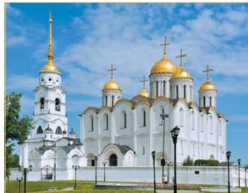
Успенский собор. Владимир. XII в.

Из Византии на Русь пришли и новые виды живописи: иконопись, мозаика и фреска.