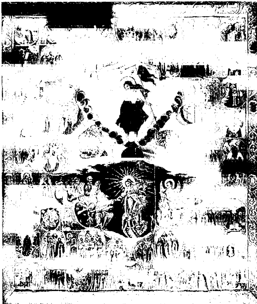
Икона «Воскресение - Сошествие во ад». XVIII в. Художественная галерея фонда поколений ХМАО – Югры