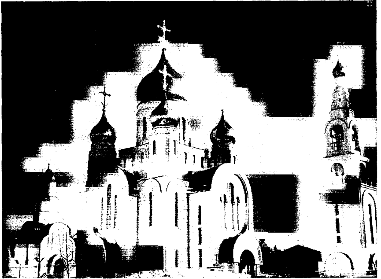
Воскресенский кафедральный собор в г. Ханты-Мансийске